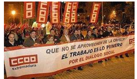
Una de las manifestaciones celebradas en las últimas semanas por la pérdida de empleos.

«No se puede generalizar. La mayoría pelea por el bienestar de su plantilla»